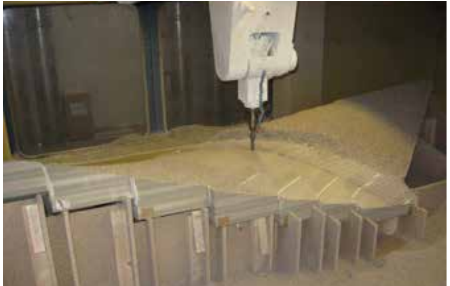
Abb. 5: Herstellung eines Sandwichkerns mittels CNC-Fräsmaschine

5: Fabrication of a sandwich core using a CNC milling machine