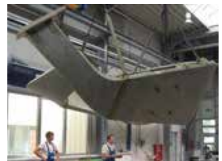
Abb. 6: Flügel mit eingebettetem Lastenleitungselement vor dem Flächenfinish und Lackieren

The free-form sculpture Virtual Tectonics 1, by Hamburg architectural studio BAT, was developed and realised in a collaboration between a range of disciplines. The sculpture is intended as a symbol for the particular opportunities offered by the use of fibre composite materials, especially of CFRP and GFRP, in the building construction industry. The aim is also to demonstrate the high level of precision possible with this method of construction. Qualities which guided the design for this abstract free-form sculpture, therefore, were high strength despite the thin cross-section, the ability to create free forms and the smooth surfaces of these fibre composite materials.