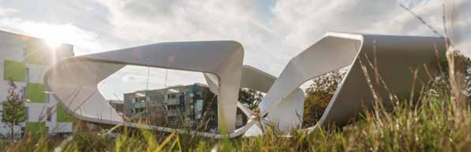
Abb. 2: Virtual Tectonics 1 auf der IBA in Hamburg 2013