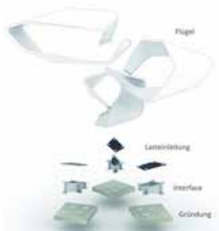
Abb. 3: Gliederung in primäre Bauelemente

Aktuell erleben wir eine Renaissance der frühen Visionen [1] für die Verwendung faserverstärkter Kunststoffe als Tragwerke des Bauwesens. Während zum Beispiel in den Emiraten schon heute mit Faserverbundwerkstoffen im größeren Maßstab gebaut wird, ist der Einsatz in Europa noch auf Sonderfälle beschränkt. Die Gründe hierfür liegen in der geringen Erfahrung bei Planung und Genehmigung, im Brandschutz sowie insbesondere in den hohen Produktionskosten. Daher kann die Entwicklung von neuen Fertigungsmethoden als Schlüssel für den gewünschten Durchbruch im europäischen Bauwesen angesehen werden.