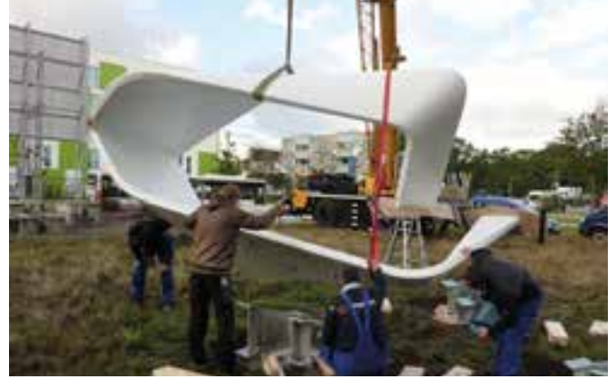
Abb. 8: Erstmögliche Montage bei der IBA in Hamburg

Fig. 7: Prepared foundation at the IBA in Hamburg