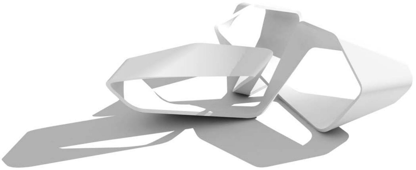
Abb. 1: Entwurf der Skulptur Virtual Tectonics 1

Fig. 1: Draft design of the sculpture Virtual Tectonics 1